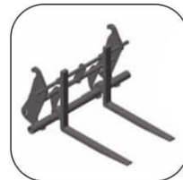
Вилы с Быстръемным Механизмом